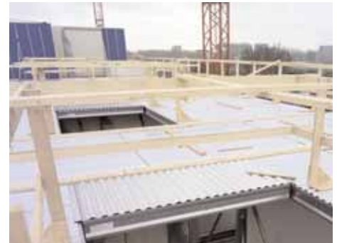
De staalframebouw vloeren van de optopwoningen zijn getoetst conform de geldende voorschriften. In dit rekenvoorbeeld zijn de toegepaste vloeren additioneel getoetst volgens de nieuwe SBR-richtlijn 'Trillingen van vloeren door lopen'.

De vloer wordt geschematiseerd als een 4-zijdig opgelegde orthotrope plaat. Bij een staalframe vloer met vloerbalken die overspannen in één richting is de buigstijfheid in de overspanningsrichting beduidend groter dan de buigstijfheid loodrecht daarop. Met de formules van paragraaf 6.2 van de richtlijn, wordt voor de verschillende vloervelden (zie overzicht) de beoordelingsklasse bepaald. Afhankelijk van de gebruiksfunctie zijn er minimale eisen gesteld aan het trillingsgedrag van de vloer. De beste klasse, met een lage ES-RMS 90 -waarde, is klasse A. De slechtste gedefinieerde klasse is klasse F. Vloeren in woningen, kantoren en winkels moeten minimaal voldoen aan klasse D, dus ook de vloeren in woongebouw "De Leeuw van Vlaanderen".